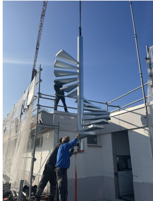
Montage der neuen Wendeltreppe