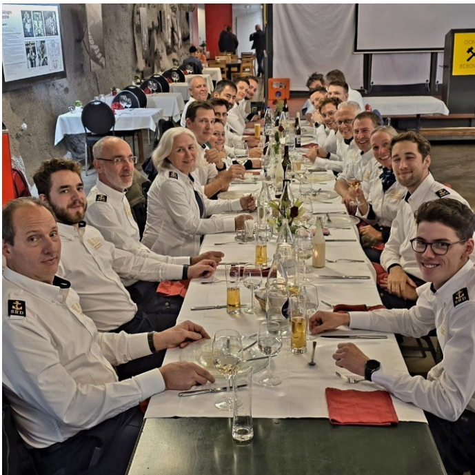
Schlussübung mit Nachtessen