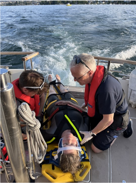
Gemeinsame Einsatzübung mit Zollikon: Kollision mehrerer Boote mit zahlreichen Verletzten