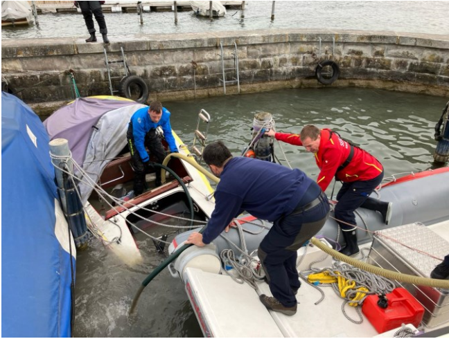
Oben und unten: Im Liegeplatz gesunkene Schiffe, schon fast wieder schwimmend.