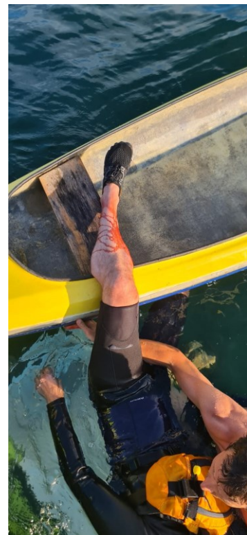
Figurant mit Schnittwunde am Bein