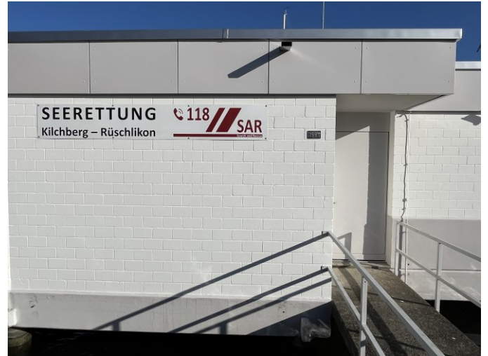
Neues Dach, neue Farbe, neues Schild